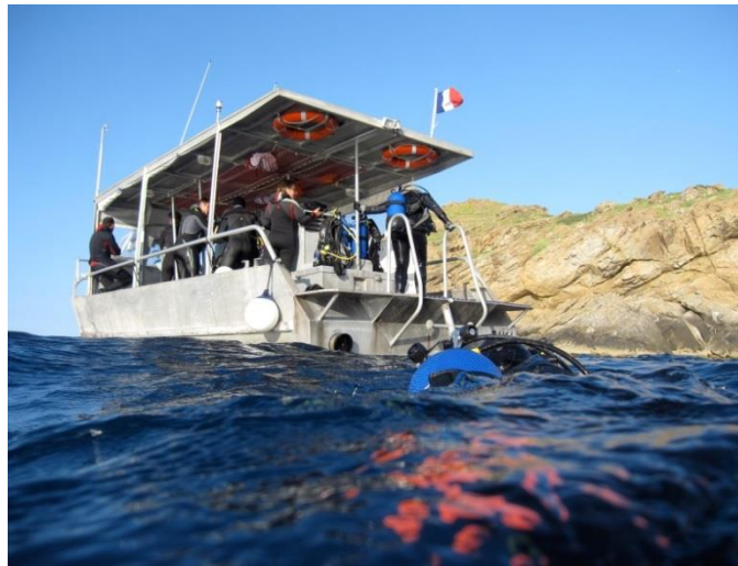
Sorties techniques et explorations