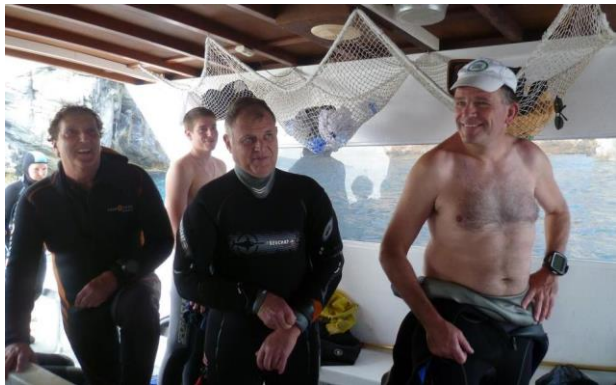
... l'équipe moniteurs Bio