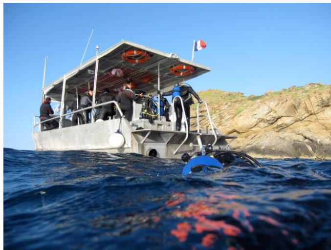
Sorties techniques et explorations